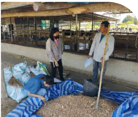
ฟาร์มคุณรองอริบ (โคนม)

พื้นที่การดำเนินงาน คือ อำเภอหนองมะโมง และ อำเภอหันคา จังหวัดชัยนาท