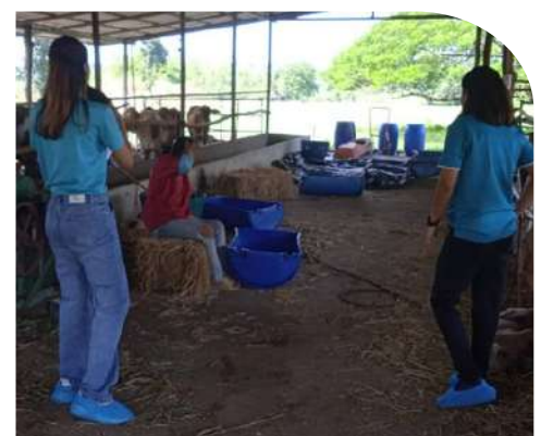
ฟาร์มครูอุไร (โคเนื้อ)