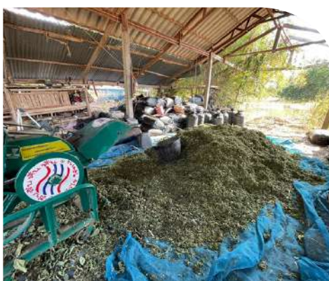
ฟาร์มลุงชุมพล (โคนม)