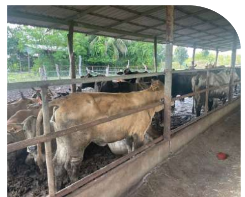
ฟาร์มครูอุไร (โคเนื้อ)