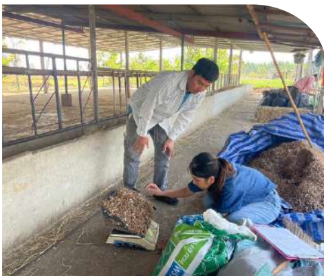
ฟาร์มคุณธงอรีย์ (โคนม)

พื้นที่การดำเนินงาน คือ อำเภอหนองมะโมง และ อำเภอหันคา จังหวัดชัยนาท