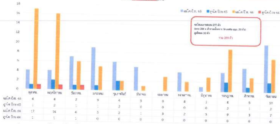
จำนวนโคนมตามสถานะ (ตัว)

๗) งบดุล ปิดบัญชีของสหกรณ์การเกษตรไพรมกยูง ณ เดือนมีนาคม ของทุกปี ในปี พ.ศ.๒๕๖๓ สหกรณ์มีรายได้ จำนวน ๕,๗๖๐,๗๗๒ บาท ปี พ.ศ.๒๕๖๔ สหกรณ์มีรายได้ จำนวน ๓๕,๕๓๖,๗๕๑ บาท ปี พ.ศ.๒๕๖๕ สหกรณ์มีรายได้ จำนวน ๒๗,๙๓๘,๘๕๑ บาท ปี พ.ศ.๒๕๖๖ สหกรณ์มีรายได้ จำนวน ๓๐,๑๔๐,๔๘๙ บาท กำไรสุทธิ ปี พ.ศ.๒๕๖๓ สหกรณ์ขาดทุน จำนวน ๖๑๘,๓๔๒.๗๑ บาท ปี พ.ศ.๒๕๖๔ สหกรณ์มีกำไรสุทธิ จำนวน ๕๑๐,๔๔๐.๘๙ บาท ปี พ.ศ.๒๕๖๕ สหกรณ์มีกำไรสุทธิ จำนวน ๔๘๒,๖๕๒.๙๘ บาท ปี พ.ศ.๒๕๖๖ สหกรณ์ขาดทุน จำนวน ๒๒๐,๓๑๕.๖๙ บาท แต่ในปี พ.ศ.๒๕๖๖ ที่ขาดทุนเนื่องจากเป็นค่าเสื่อมสภาพ ดังนั้นสหกรณ์ยังสามารถดำเนินการต่อไปได้